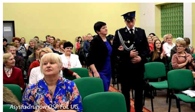
Asysta druhów OSP.

Organizatorzy składają serdeczne podziękowania tegorocznym sponsorom, konkursu „Kobieta Roku”, a byli nimi: