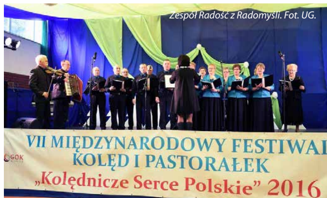
Zespół Radość z Radomyśli.