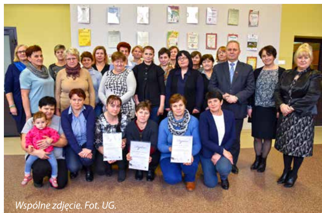
Wspólne zdjęcie.