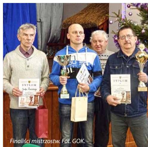
Finaliści mistrzostw.