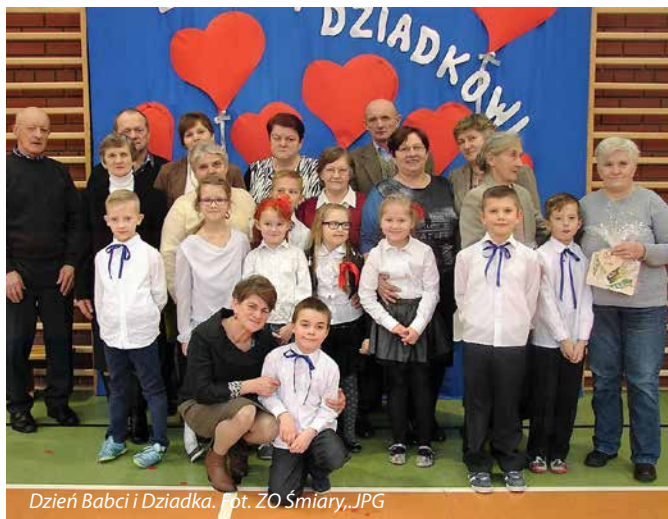
Dzień Babci i Dziadka. fot. ZO Śmiary, JPG

Choinka na rozpoczęcie ferii to już w Zespole Oświatowym w Śmiarach tradycja. W tym roku szkolnym odbyła się ona 30 stycznia 2016 r. Tego dnia sala gimnastyczna zamieniła się w salę balową, dzięki pięknej dekoracji. „Choinka” w naszej szkole to także wspólna okazja do bliskiej współpracy z rodzicami, którzy w tym roku zadbali nie tylko o bufet z ciepłymi przekąskami i słodkościami, pilnowali porządku, ale również dokonali metamorfozy hali sportowej.