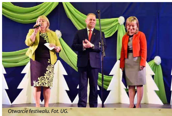
Otwarcie festiwalu.

Zgodnie z regulaminem każdy zespół miał do wykonania w konkursie dwie kolędy i jedną pastorałkę. Soliści występowali