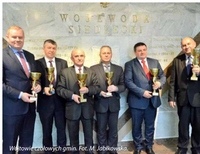
Wójtowie czołowych gmin.