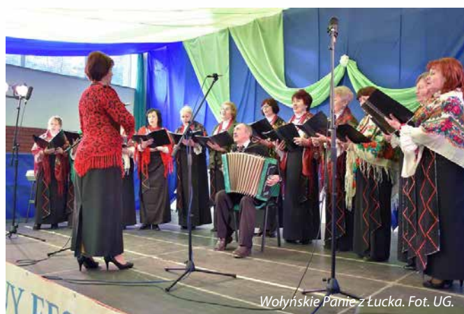
Wołyńskie Panie z Łucka.