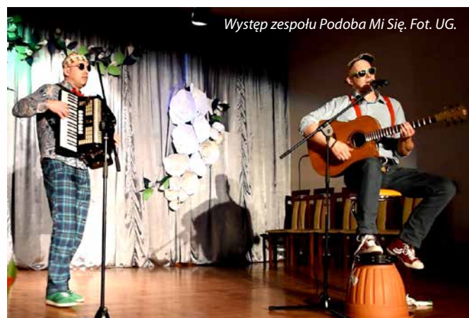
Występ zespołu Podoba Mi Się.