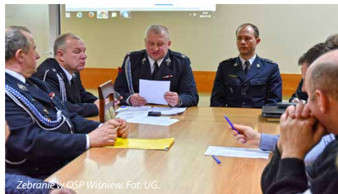
Zebranie w OSP Wiśniew.