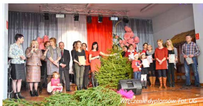
Wręczenie dyplomów.