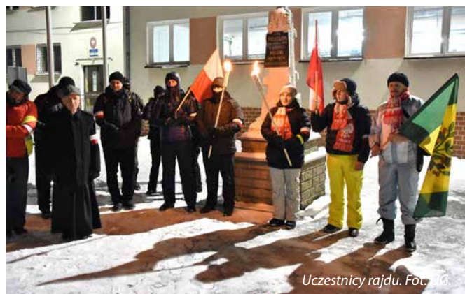
Uczestnicy rajdu.

Pierwszy postój odbył się w Mroczkach, gdzie po zapaleniu zniczy i krótkiej modlitwie przed pomnikiem upamiętniającym mieszkańców wsi Mroczki walczących i poległych za Ojczyznę, grupa udała się do Wiejskiego Domu Kultury na ciepły poczęstunek przygotowany przez - jak zwykle gościnnych - mieszkańców sołectwa.