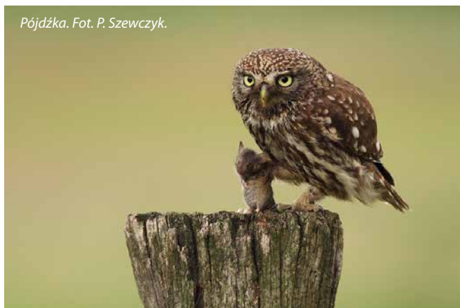
Pójdźka.