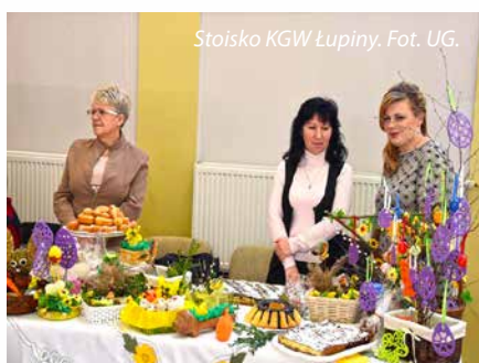
Stoisko KGW Łupiny.