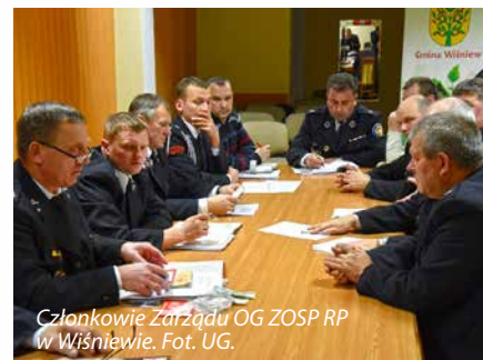
Członkowie Zarządu OG ZOSP RP w Wiśniewie.

ZOSP RP w Wiśniewie zaplanowano na dzień 12 czerwca 2016 r.