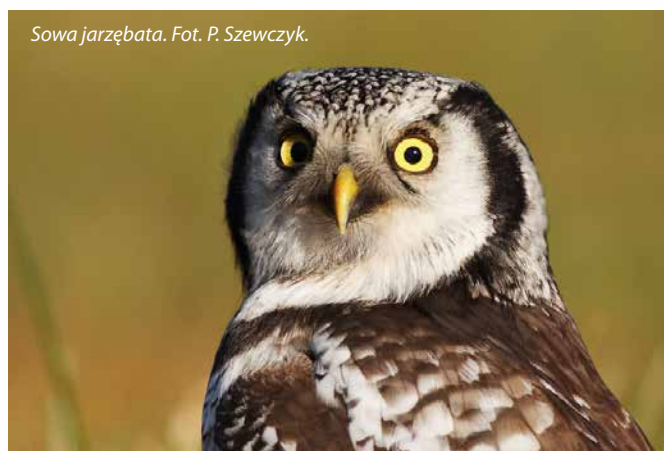
Sowa jarzębata.

prawdziwych rzadkości, jakie można spotkać na terenie naszej gminy zalicza się na pewno rybołów i kulik wielki. Rybołów to bardzo rzadki ptak drapieżny. W Polsce znajduje się ok. 30 – 35 par łęgowych. Na wiosennych i jesiennych migracjach ptaków można jednak go spotkać w kompleksie stawów w Mościbrodach, gdzie poluje na ryby. Dodam, że nie jest to wyjątkowo płochliwy ptak. Pozwala się obserwować z odległości mniejszej niż 100 metrów. Jest to niezwykle widok, kiedy polujący rybołów z ogromną prędkością nurkuje, wbijając się w lustro wody. Wspomniany przeze mnie kulik wielki. Kiedyś, dwadzieścia, trzydzieści lat temu, był to dość pospolity ptak w naszym kraju. Niestety jego liczebność na przełomie lat zaczęła drastycznie spadać. Obecnie szacunkowa liczba par kulika wielkiego, jaka znajduje się na terenie Polski wynosi pomiędzy 200, a 300 par. Na terenie naszej gminy, pomiędzy miejscowościami Ciosny i Radomyśl w ubiegłym roku udało mi się namierzyć dwie pary łęgowe tego rzadkiego ptaka. Niestety obie pary nie dochowały się potomstwa, ponieważ ich gniazda zostały splądrowane przez drapieżnika, najprawdopodobniej był to lis.