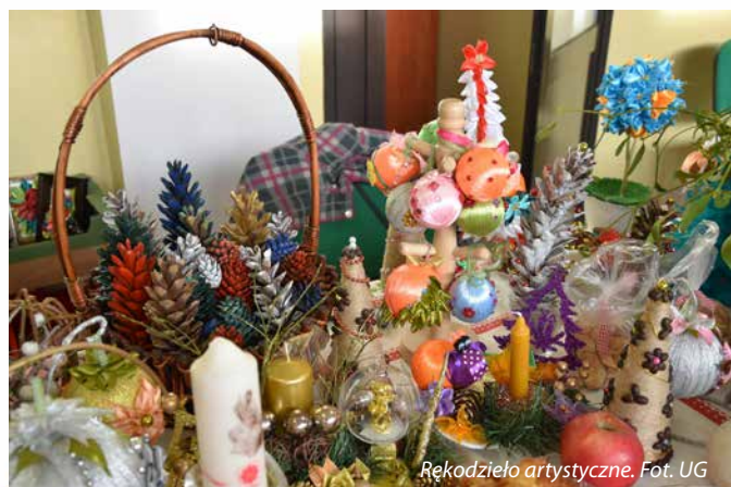
Rękodzieło artystyczne.