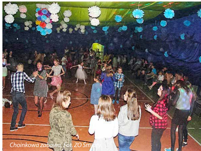
Choinkowa zabawa.

W szampańskiej zabawie tanecznej, do której nikogo nie trzeba było namawiać, przeplatanej licznymi konkursami i dedykacjami, wzięli udział nie tylko nasi uczniowie, ale także ich rodzice, znajomi