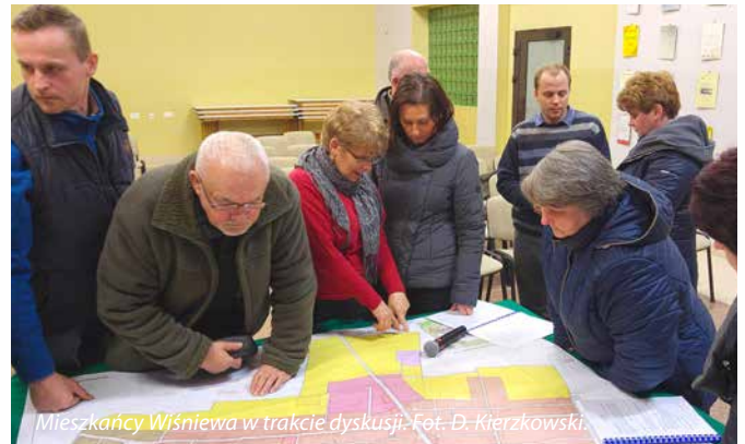
Mieszkańcy Wiśniewa w trakcie dyskusji.

Po wprowadzeniu wójt główny projektant planu przedstawił założenia i przyjęte rozwiązania w opracowanym dokumencie. Zazaczył, że część rozwiązań komunikacyjnych wynika z bardzo rygorystycznego podejścia Generalnej Dyrekcji Dróg Krajowych i Autostrad w Warszawie, która nie wyraża zgody na powstawanie nowych skrzyżowań dróg.