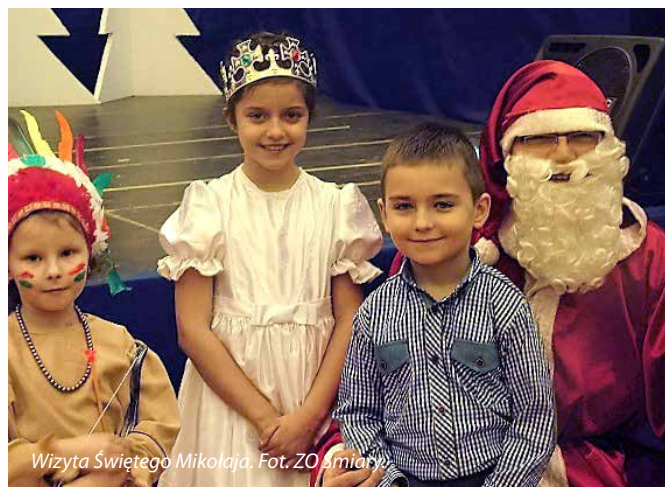
Wizyta Świętego Mikołaja.

Bogaty i ciekawy program „Choinki” sprawił, że to wydarzenie z pewnością na długo zapadnie w pamięci wszystkich miłośników dobrej zabawy. A następne spotkanie w tanecznych rytmach już za rok.