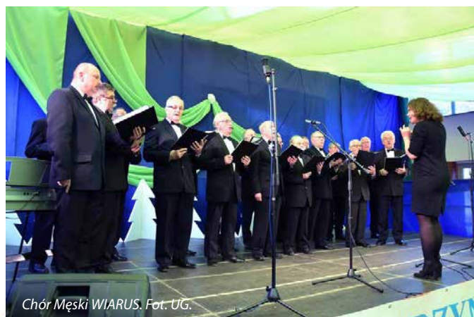
Chór Męski WIARUS.