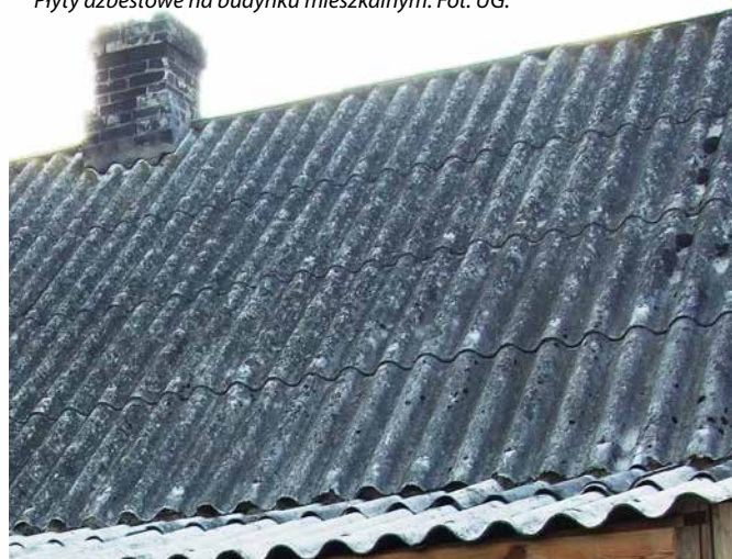
Płyty azbestowe na budynku mieszkalnym.