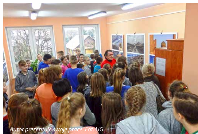
Autor prezentuje swoje prace.