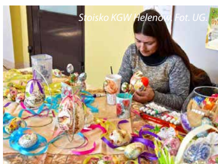
Stoisko KGW Helenów.