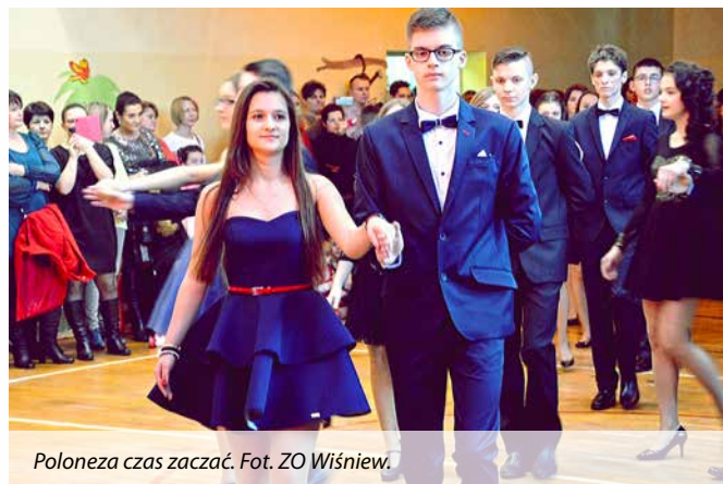
Poloneza czas zacząć.

Jako trzeci, na deskach ośrodka kultury, pojawili się uczniowie klasy z II b. Zaprezentowali pomysłowe scenki, w których wiersze przeplatane z polskimi kołędami tworzyły magiczną atmosferę.