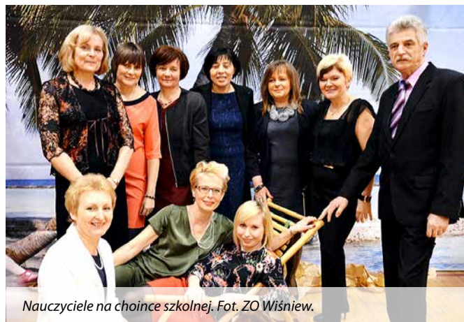
Nauczyciele na choince szkolnej.