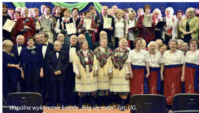
Wspólne wykonanie kolędy „Bóg się rodzi”.

Na zakończenie tradycyjnie wszystkie zespoły odśpiewały kolędę „Bóg się rodzi”. Następnie wszyscy goście zostali zaproszeni na poczęstunek.