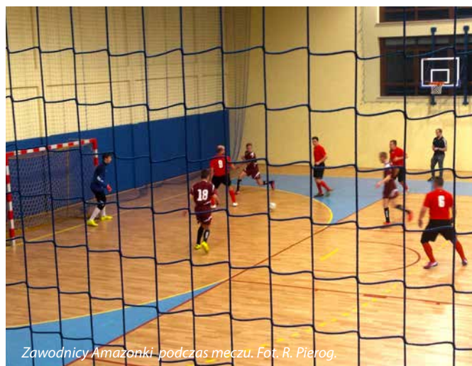
Zawodnicy Amazonki podczas meczu.