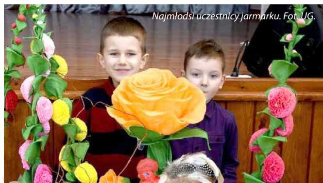
Najmłodszy uczestnicy jarmarku.