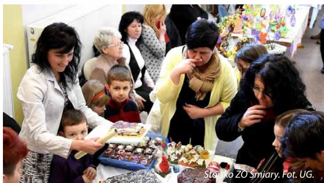
Stoisko ZO Śmiary.