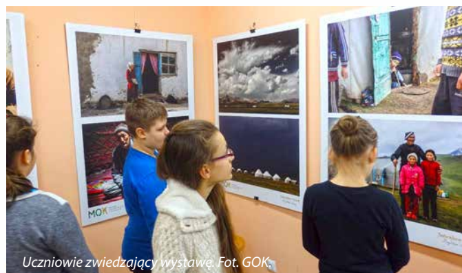
Uczniowie zwiedzający wystawę.