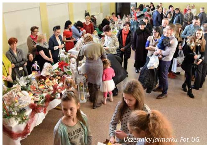
Uczestnicy jarmarku.