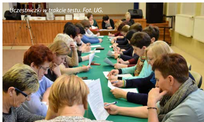
Uczestniczki w trakcie testu.

Wszystkie uczestniczki Olimpiady otrzymały nagrody rzeczowe ufundowane przez Urząd Gminy Wiśniew, które wręczył wójt Krzysztof Kryszczuk .