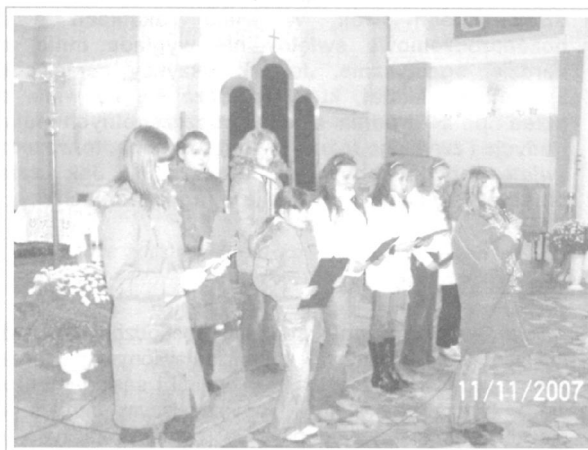
Montaż słowno – muzyczny w wykonaniu uczniów Gimnazjum Publicznego w Wiśniewie.