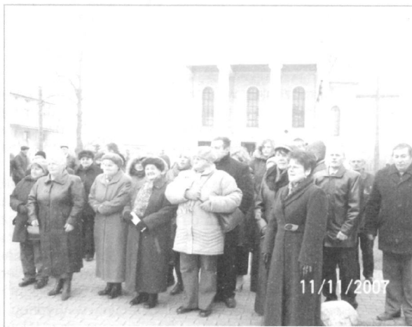
Na placu przed pomnikiem.

- Tegoroczna rocznica odzyskania niepodległości przebiegła na terenie naszej gminy godnie i uroczysto. Dziękuję wszystkim mieszkańcom, którzy w tym dniu przyłączyli się do świątecznego nastroju, dekorując swoje domy narodowymi barwami. Dziękuję również szkołom, zakładom pracy za wywieszenie flag państwowych, które zaakcentowały w tym szczególnym dniu naszą państwowość oraz przywiązanie i szacunek do barw narodowych – powiedział wójt gminy Wiśniew - Krzysztof Kryszczuk .