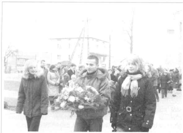
Młodzież składa wiązanki kwiatów pod pomnikiem „legionowy”.

Dzień 11 listopada ustanowiono świętem narodowym dopiero ustawą z kwietnia 1937 roku, czyli prawie 20 lat po odzyskaniu niepodległości. Narodowe Święto Niepodległości przywrócono ustawą sejmową w 1989 roku. Jest to jedno z najważniejszych świąt państwowych w niepodległej Polsce.