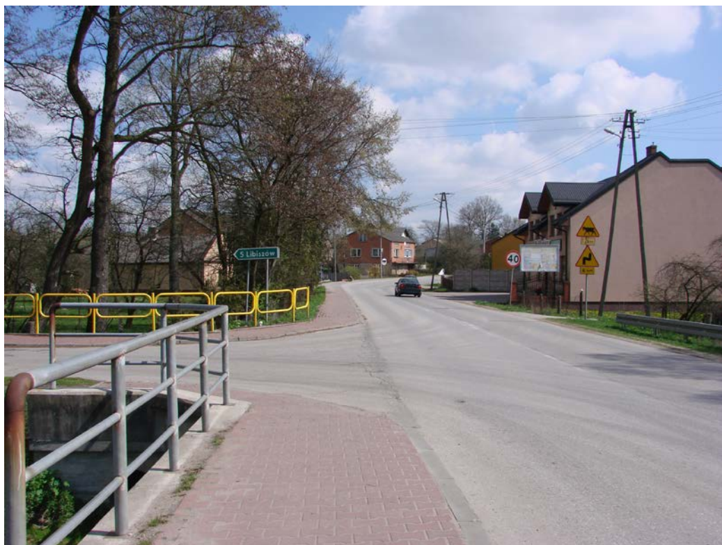
Fotografia 1. Droga powiatowa nr 3108E w kierunku Wygnanowa

Głównym ciągiem komunikacyjnym miejscowości Wola Załączna jest droga powiatowa 3108E Opoczno – Drzewica. Droga klasy G, posiada nawierzchnię bitumiczną w dobrym stanie. Droga została zmodernizowana w 2007 roku w ramach projektu Powiatu Opoczyńskiego „Przebudowa drogi powiatowej nr 3108E na odcinku Opoczno Wygnanów” dofinansowanego ze środków Unii Europejskiej w ramach Regionalnego Programu Operacyjnego Województwa Łódzkiego na lata 2007-2013.