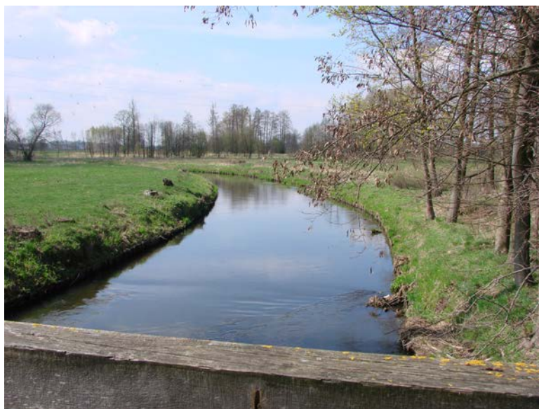
Fotografia 4. Koryto Drzewiczki - widok z Woli Załężnej w kierunku Opoczna.

Malowniczy krajobraz sołectwa podkreśla również obecność Lasu Wolskiego.