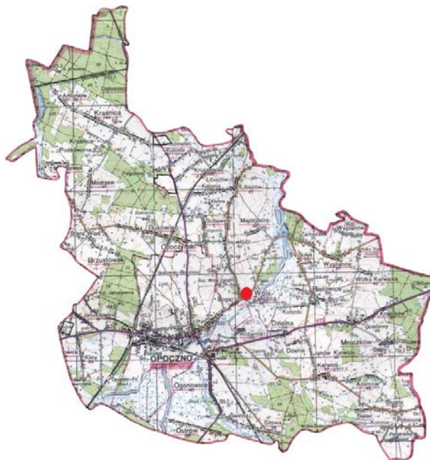
Mapa 4. Położenie Woli Załężnej w Gminie Opoczno.

W miejscowości wyróżnia się 10 części miejscowości wymienionych w wykazie jednostek osadniczych w Rozporządzeniu Ministra Administracji i Cyfryzacji z dnia 13 grudnia 2012 roku w sprawie wykazu urzędowych nazw miejscowości i ich części: