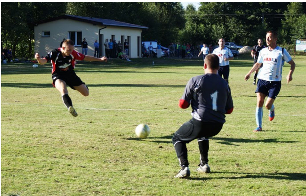
Fotografia 7. Boisko i szatnia w Woli Załęznej. 10

Wieś jest w całości zwodociągowana. Długość kanalizacji, wybudowanej przez PGK w Opocznie z dofinansowaniem w ramach Programu Operacyjnego Infrastruktura i Środowisko wynosi 7324,5 m.