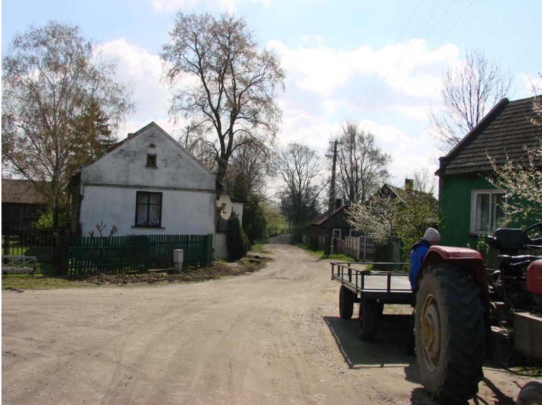
Fotografia 3. Droga gminna nr 107157E w kierunku Dzielnej.

Przez Wolę Załęzną przebiega również droga gminna 107157E Wola Załęzna – Dzielna o nawierzchni gruntowej w bardzo złym stanie – wymagająca budowy wraz z przebudową mostu na rzece Drzewiczka.