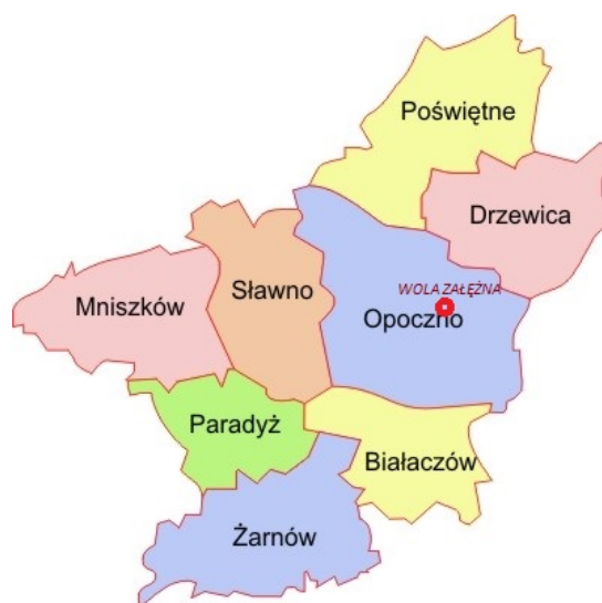
Mapa 3. Położenie gminy Opoczno w powiecie opoczyńskim

Sołectwo Wola Załęzna jest jednym z 34 sołectw Gminy Opoczno. Miejscowość leży tuż przy wschodniej granicy Opoczna, od południa sąsiaduje w Dzielną i Różanną, od wschodu z sołectwem Sołek i Bielowice, od północy z Sobawinami i Międzyborzem.