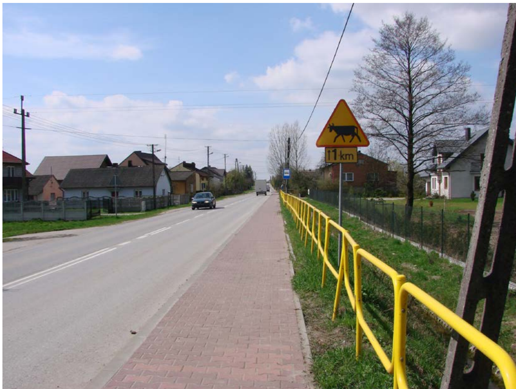
Fotografia 2. Droga powiatowa nr 3108E w kierunku Opoczna

Prostopadłą do 30138E jest droga powiatowa 3019E rozpoczynająca się w Woli Załącznej, prowadząca do Drzewicy. Droga klasy G, o nawierzchni bitumicznej jest w bardzo złym stanie technicznym i wymaga całkowitej przebudowy.