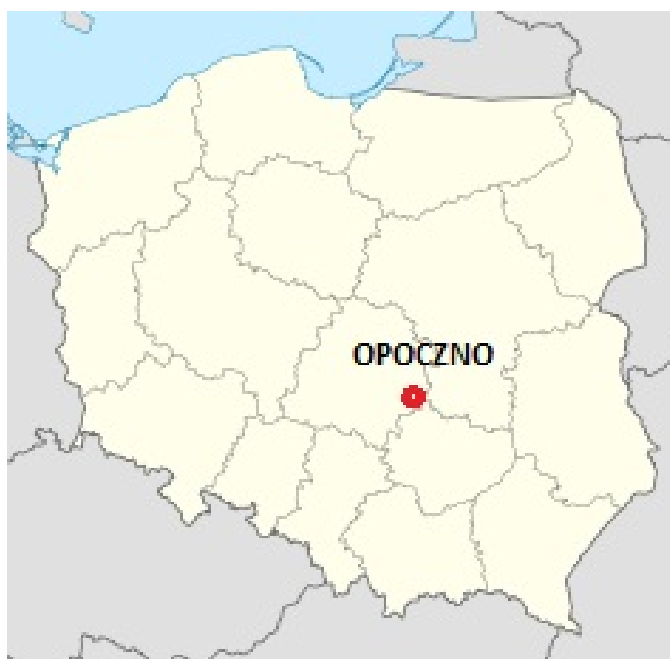
Mapa 1. Położenie gminy Opoczno na tle mapy Polski

Jej rozciągłość południkowa wynosi 20,2 km a równoleżnikowa 19,0 km.