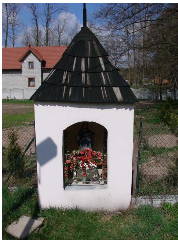
Fotografia 6. Kapliczka przydrożna.