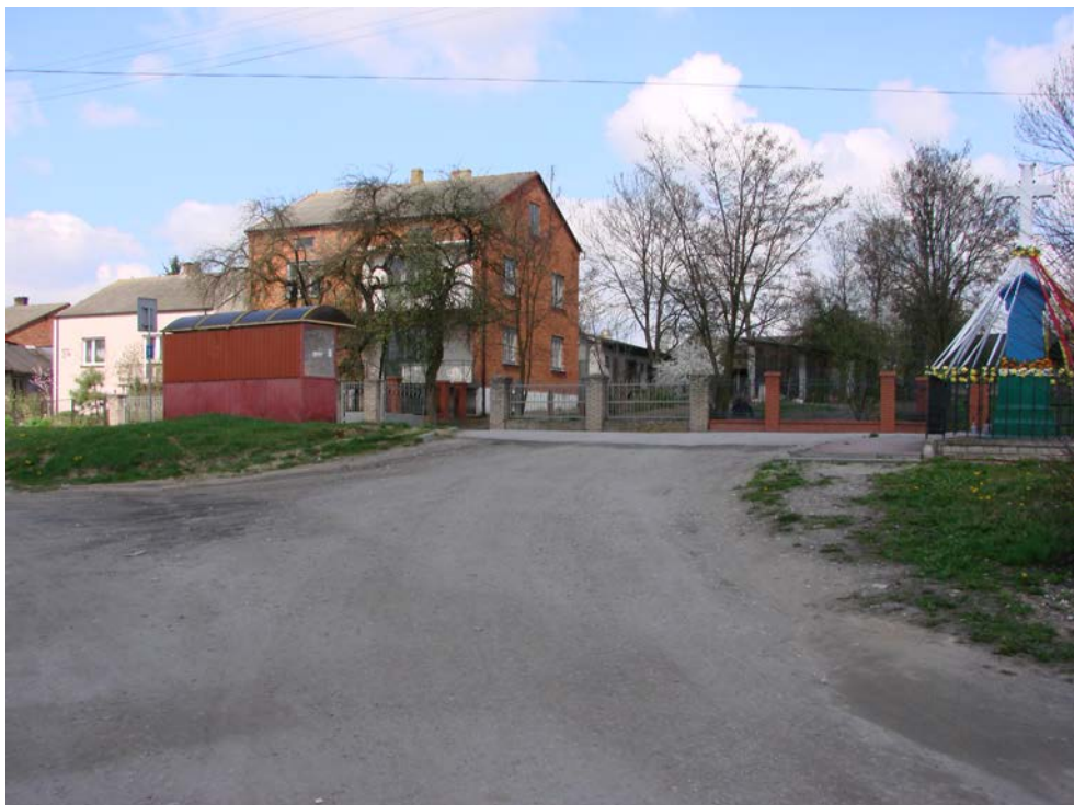
Fotografia 3. Droga gminna nr 107157E – skrzyżowanie z drogą powiatową nr 3109E.