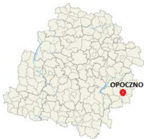
Mapa 2. Położenie gminy Opoczno w województwie łódzkim