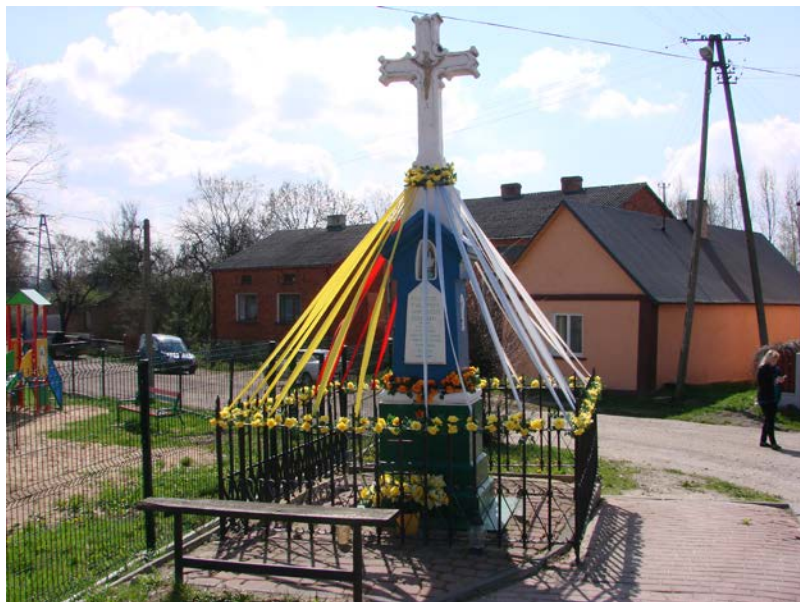
Fotografia 5. Kapliczka na rozstaju dróg z 1901 roku.