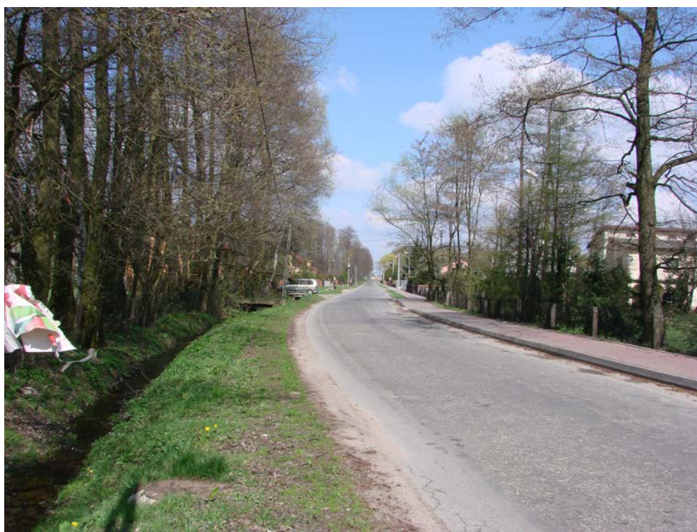
Fotografia 3. Droga powiatowa nr 3109E w kierunku Libiszowa

Prostopadłą do 30138E jest droga powiatowa 3019E rozpoczynająca się w Woli Załącznej, prowadząca do Drzewicy. Droga klasy G, o nawierzchni bitumicznej jest w bardzo złym stanie technicznym i wymaga całkowitej przebudowy.