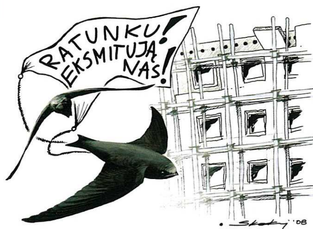
Ryc. T. Skakuj

Wyd. Stołeczne Towarzystwo Ochrony Ptaków, Warszawa, 2010